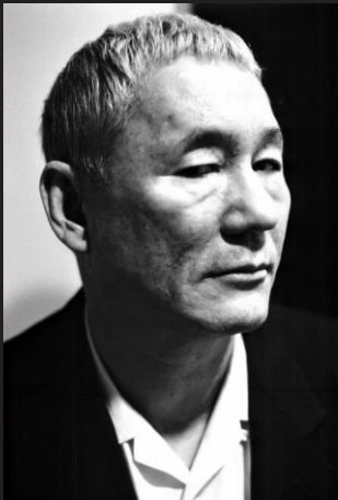
Takeshi Kitano, actor, film director