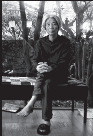
Hiroshi Hara, architect