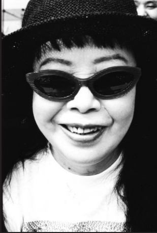
Yayoi Kusama, artist